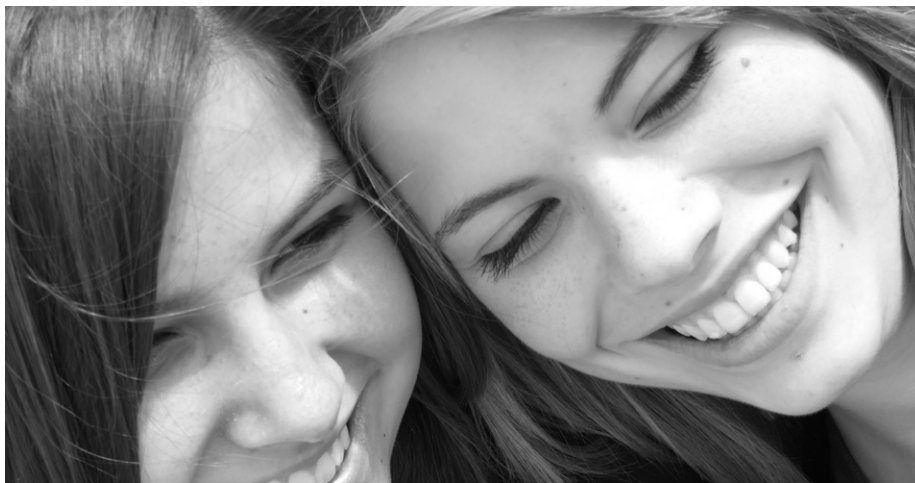
Berufliche Gründe sind die wichtigsten Argumente für Zu- und Zurückgezogene in Brandenburg (wieder) heimisch zu werden. Die CDU-Landtagsfraktion setzt mit einem Antrag genau an diesem Punkt an. Sie möchte die Rückkehrbereitschaft ehemaliger Brandenburger Fachkräfte unterstützen.